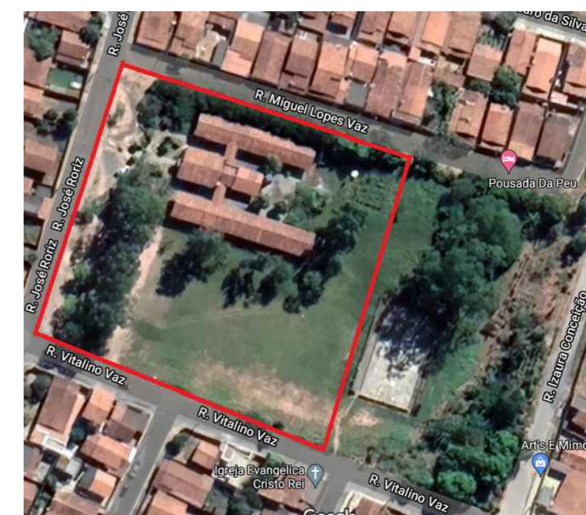
PLANTA DE SITUAÇÃO Sen Escola