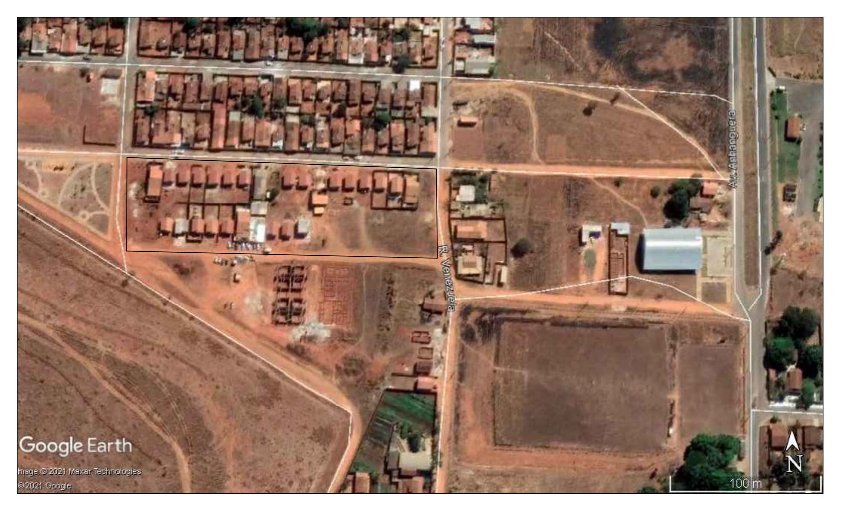
Planta de Situação Sem Escala