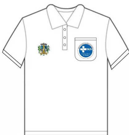
Camiseta manga curta