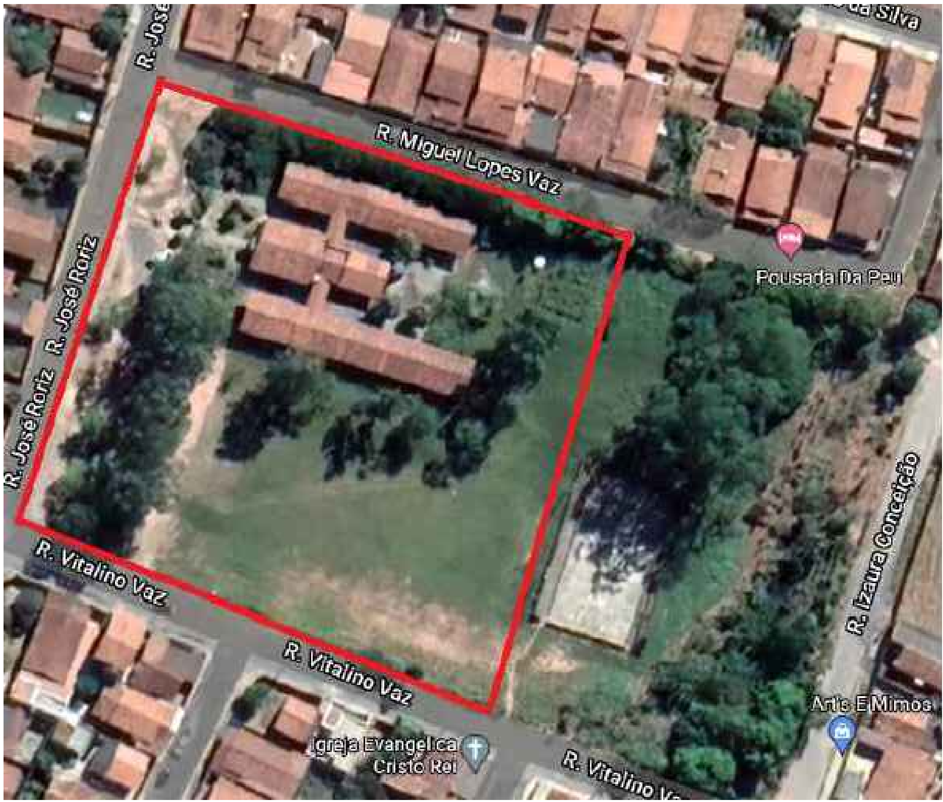
PLANTA DE SITUAÇÃO Sem Escola